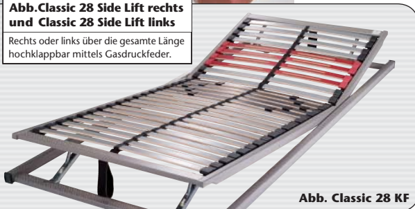
Abb. Classic 28 KF

Rechts oder links über die gesamte Länge hochklappbar mittels Gasdruckfeder.